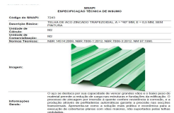
telha 1 rcc.JPG 96 KB