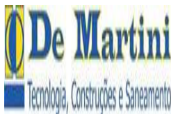
image002.jpg 5 KB